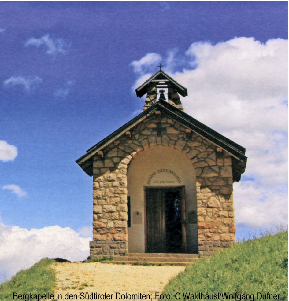
Bergkapelle in den Südtiroler Dolomiten; Foto: C Waldhäusl/Wolfgang Dufner